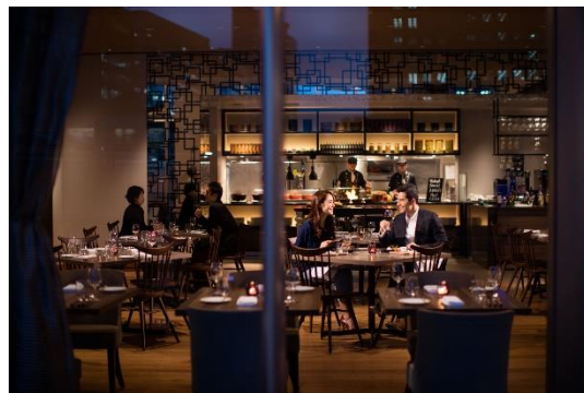
Dining & Bar LAVAROCK イメージ