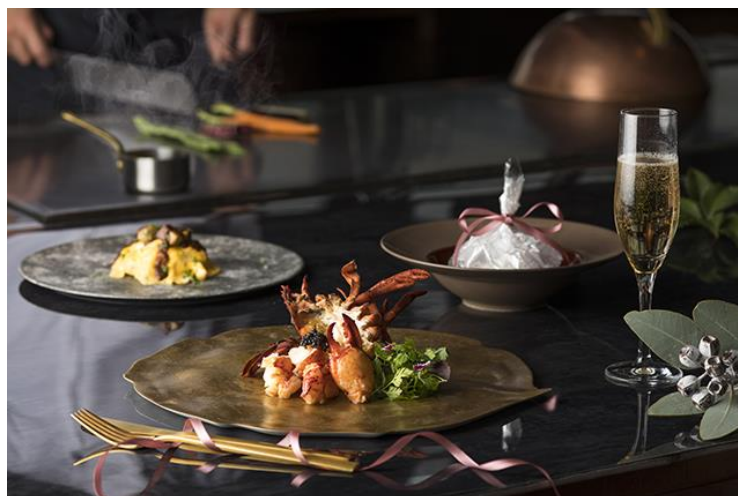
Xmas Dinner Course “縦”

期間：2018 年 12 月 21 日（金）～2018 年 12 月 25 日（火）