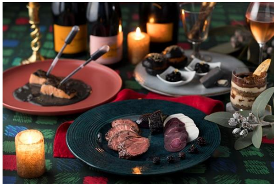
Xmas High Tea イメージ

本プランは、シャンパンをはじめとしたフリーフロースタイルで提供する多彩なドリンクと、ティースタンドに並ぶ華やかなお料理が好評の、「Bar19」のハイティーとご宿泊がセットになったプランです。大阪の夜景が映える照明を落としたホテル最上階のバーでしっとりとした時間をお過ごしいただいた後は、ハイフロアでご用意するスタイリッシュでモダンな客室でおくつろぎください。翌朝には、光差し込むダイニングで心地よい朝食を。レイトチェックアウト特典で、午後までゆったりとお過ごしいただけます。