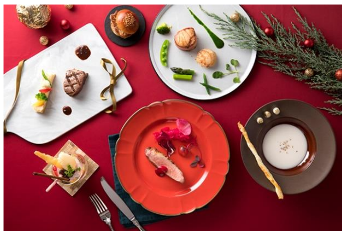
Xmas Dinner Course “Noël”イメージ

ホテルロビー階の「Dining & Bar LAVAROCK」では、鴨肉のローストに添えたピーズのレッド、下仁田ネギとポワローのホワイト、鮮やかなグリーンソースを添えた鱈と帆立のムニエルなどクリスマスカラーを取り入れた心華やぐクリスマスディナーコースをお届けいたします。メインは、香り豊かなペリグーソースでいただくオレガノビーフの牛フィレ肉を。一面ガラス張りの店内からクリスマスに心躍らせる街を眺めながら、オープンキッチンから運ばれる色鮮やかなグリルディナーをお楽しみください。