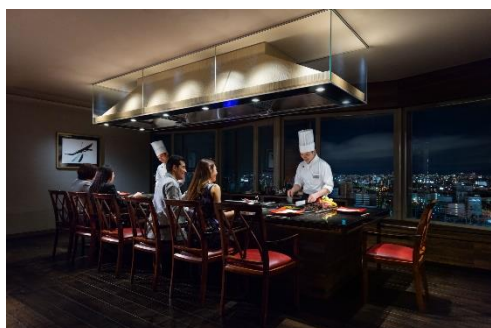
鉄板焼き 一花一葉 イメージ