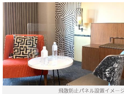
飛散防止パネル設置イメージ

※8日間以上連続でお申し込みの場合、8日目以降のご利用代金は1日あたり¥5,000でご利用いただけます。